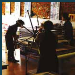
ATELIER DE LA MAIN GAUCHE*