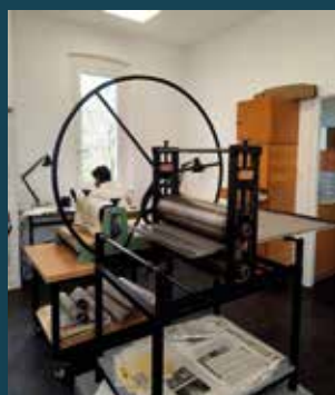
ASSOCIATION TOULOUSE GRAVURE