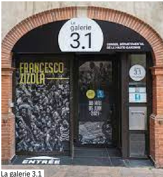
La galerie 3.1