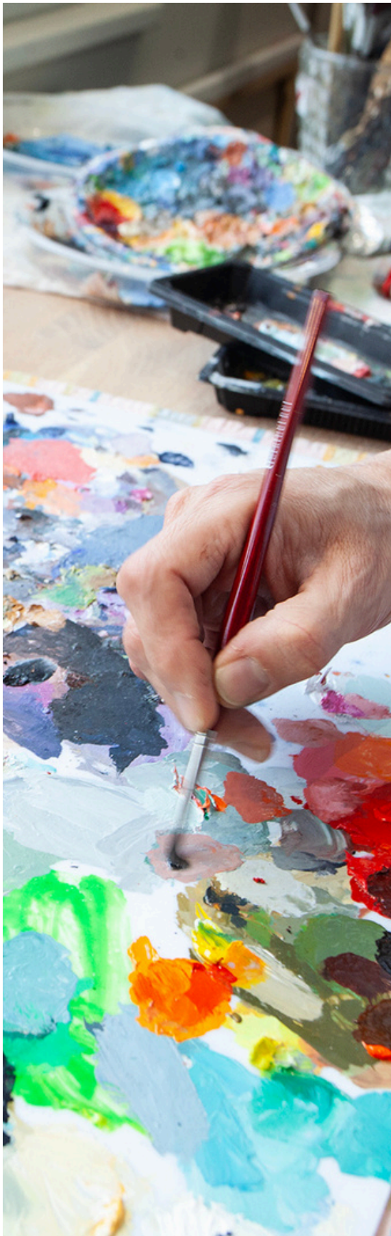
MaximeLavie©Patty Moussali Photography.

« Les arts et le vélo, ce sont deux plaisirs qui alternent, se succèdent et se complètent. »