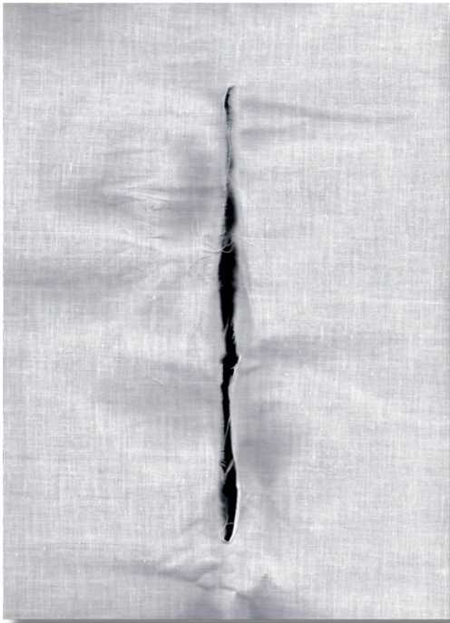
Fisura ©Olga Simón