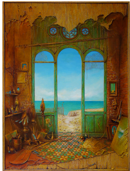
L'atelier des masques à plumes

Retrouvez Philippe Vercelotti l'atelier 18 (12, rue d'El Alamein, 31500 Toulouse).